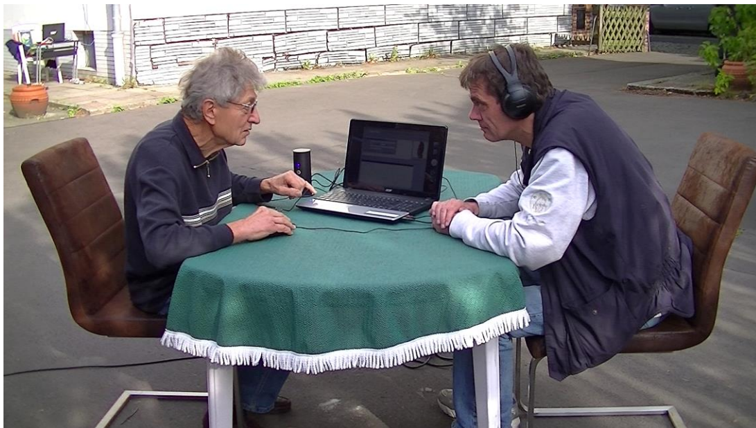
Durchführung einer Gesundheitsanalyse mit dem BSS100 (Foto: Dr. Fenzlein, 03/14)

Darüber hinaus zeigen die von den Körperfrequenzen mitgeführten Informationen auch, was die Energie des Körpers insgesamt oder einzelner Organe schwächt. Man bekommt somit vom Körper eine Anleitung zum Handeln, wie man seinen Gesundheitsstatus sichern oder weiter verbessern kann.