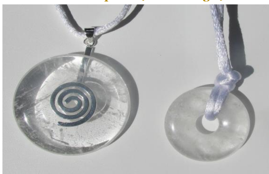
SH groß & Spirale Seelenhüter klein ohne Spirale

8. Urbewußtseinsquelle (Kristallkugel) = 200,00 EUR PP