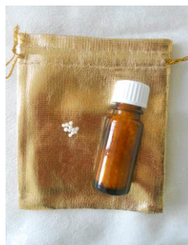
Seelen- bzw. Regenerationsglobuli